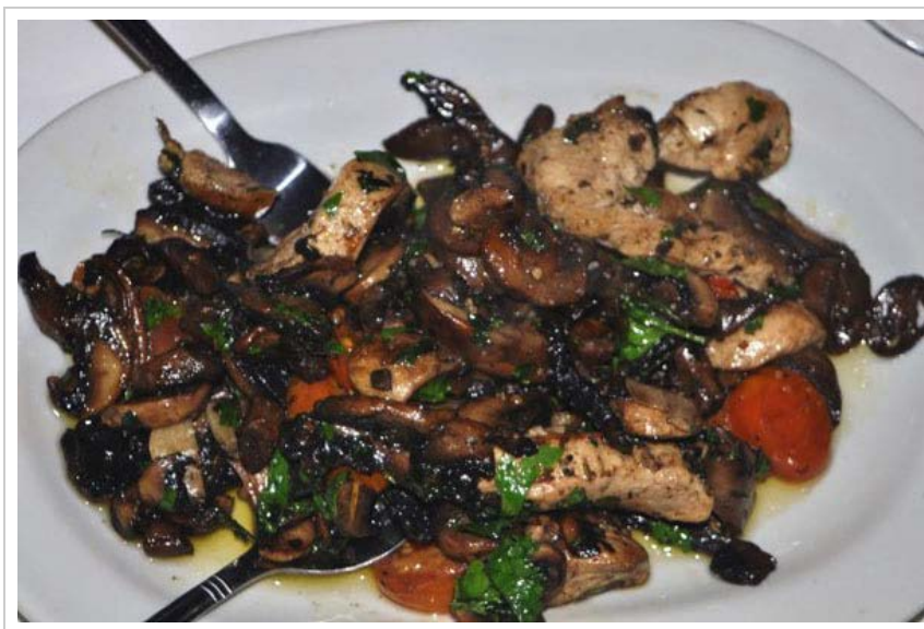
Caponata, una de las especialidades del restaurante.

A pocos metros del Congreso de la Nación, en pleno barrio de Montserrat, se ubica "María Fedele. Cocina de mercado. Ristorante", en la sede de la Asociación Nazionale Italiana (Alsina 1465).